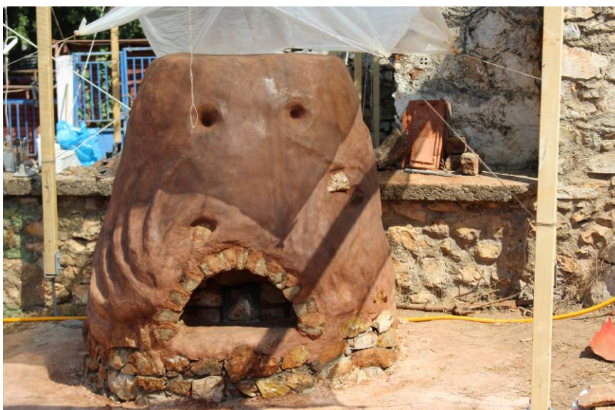
Φύση/όρια/υλικά II του 2016. Ο φούρνος για τα κεραμικά

Θα γίνουν δεκτοί έως 20 συμμετέχοντες ανά δράση . Σε περίπτωση που οι ενδιαφερόμενοι είναι περισσότεροι θα υπάρξει διαδικασία επιλογής με συνέντευξη όπου θεωρηθεί αναγκαία