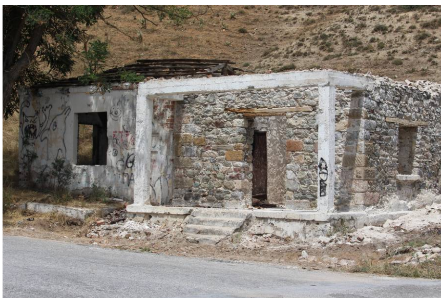
Φυλάκιο στο Λαδοπόταμο, Τόπος διεξαγωγής της διαδικασίας Αύγουστος 2017, μετά την υδροβολή