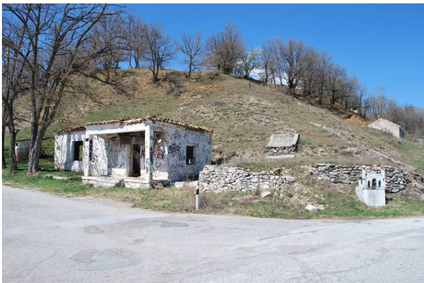
Φυλάκιο στο Λαδοπόταμο, Τόπος διεξαγωγής της διαδικασίας Αύγουστος 2016

Οι διαδικασίες θα ολοκληρωθούν με ένα Διεθνές Συνέδριο για το Μνημείο (ημερομηνίες θα ανακοινωθούν)