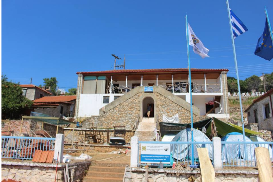
Ο Σταθμός του ΤΕΕΤ στους Ψαράδες, τόπος διεξαγωγής της διαδικασίας