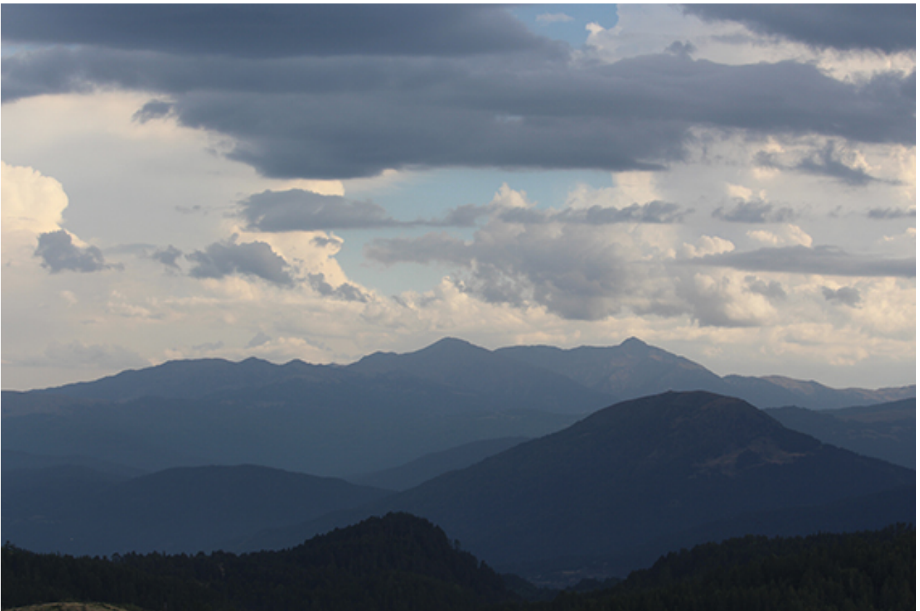
Κορυφές του Γράμμου στα ελληνοαλβανικά Σύνορα, (φώτο Γιάννης Ζιόγας)

Γράμμος: Ο Μεγάλος Ελιγμός, 24 έως 28 Αυγούστου 2018