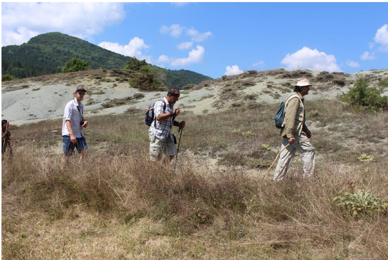
Εικαστική Πορεία 2016: στη Διαδρομή της Μεγάλης Πορείας (21 Αυγούστου)

-Το Τοπίο ως ετερότητα, το Τοπίο ως ύλη, το Τοπίο ως Πεδίο